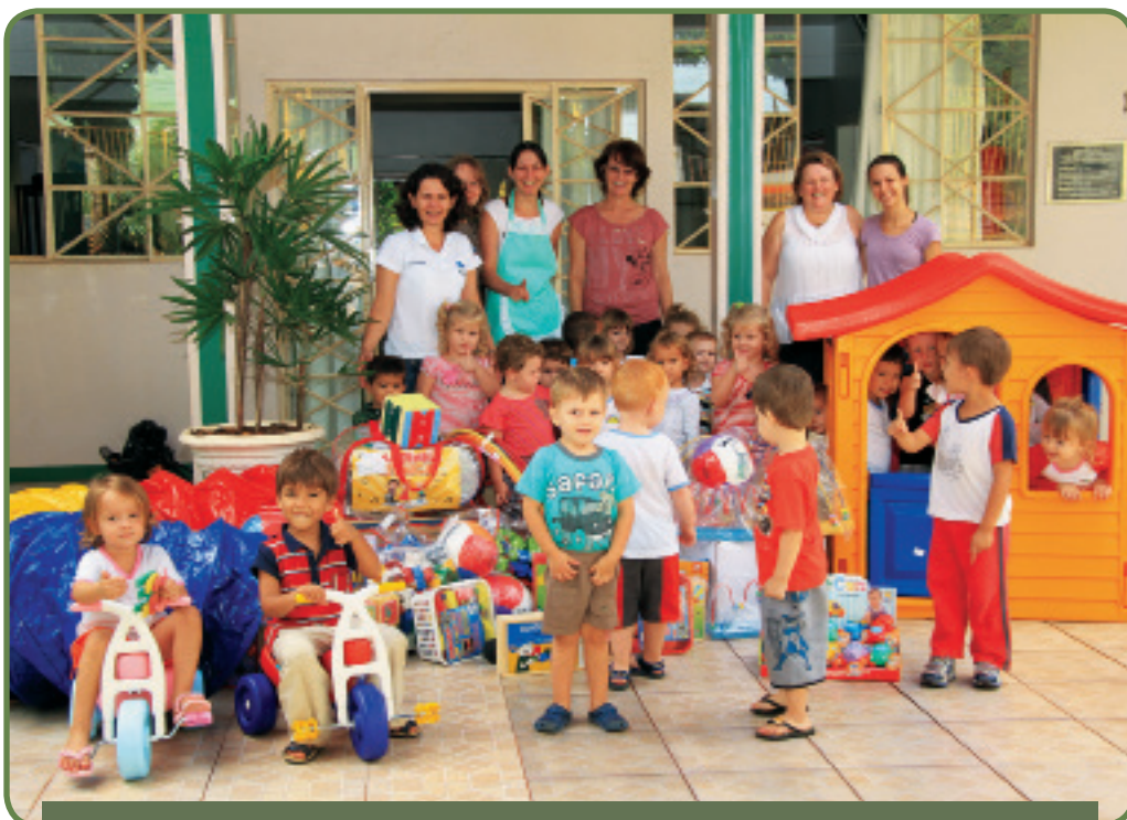
Secretaria Municipal de Educação de Missal (PR) recebe recursos através da adesão a Programa Brasil Carinhoso

CRECHES – Uma das ações mais importantes para a promoção da autonomia econômica das mulheres e da igualdade de direitos com os homens é o investimento na educação infantil e, em especial, a ampliação de vagas em creches, por que reduz a dupla jornada de trabalho das mulheres, favorece a sua busca por autonomia econômica, inclusive para sua inserção no mercado de trabalho. O governo federal, a partir de 2012, lançou algumas iniciativas neste sentido com o Programa Brasil Carinhoso.