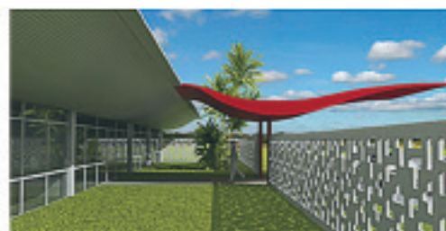
Casa da Mulher Brasileira - projeto