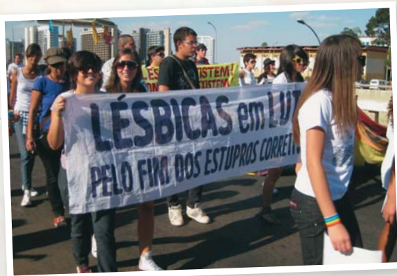
Arquivo Coturno de Vênus

O dia é de celebração e festa, mas também de reflexão e de luta feminista pelo fim do sexismo e da lesbofobia. Uma causa que tem que ser abraçada por tod@s. O 29 de agosto - Dia Nacional da Visibilidade Lésbica foi comemorado em vários estados do país. Em Brasília, com o mote “Somos muitas e estamos em todas as partes e lugares” comemorou-se com marcha, batucada e muita festa na Praça Galdino – marco político para os movimentos sociais que lutam para que muitas existências sejam possíveis e respeitadas em suas singularidades.