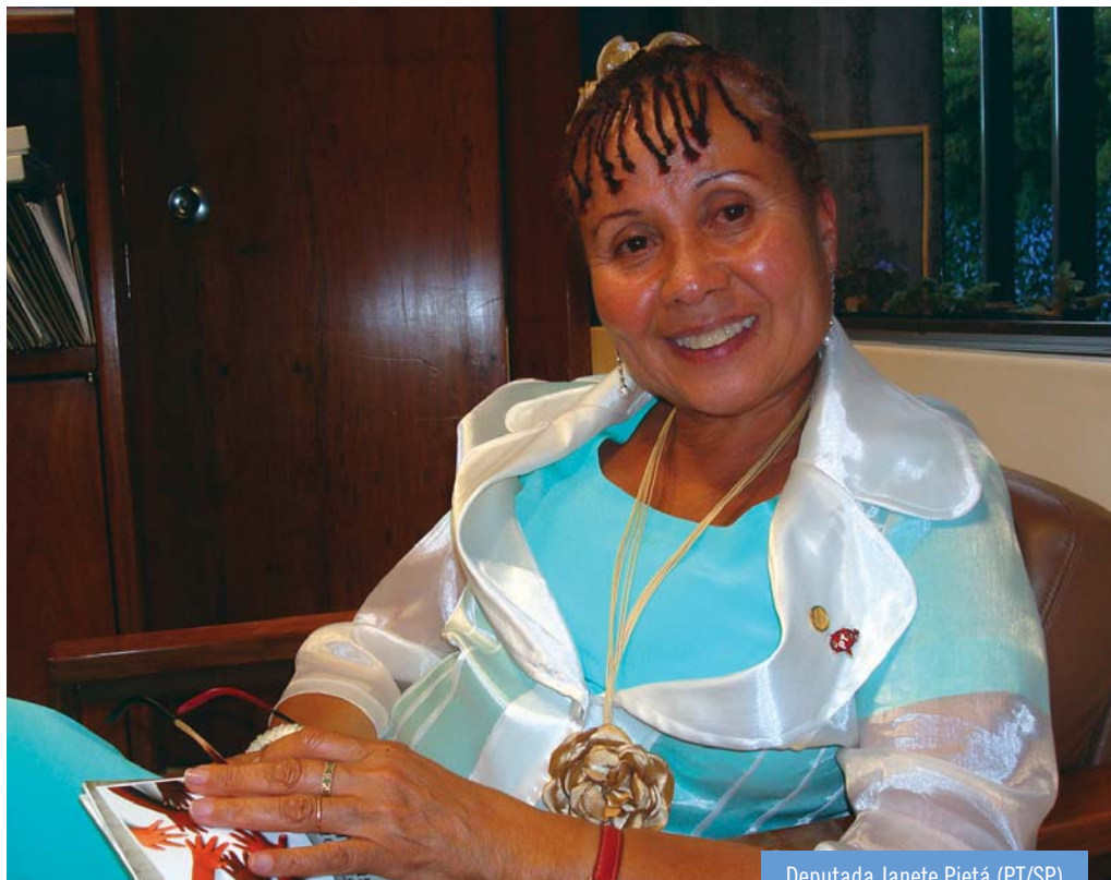
Deputada Janete Pietá (PT/SP)

A deputada Janete Pietá preside, atualmente, a Comissão Especial que analisa a proposta de emenda constitucional (PEC) para a criação de Varas Especializadas nos Juizados Especiais para as questões