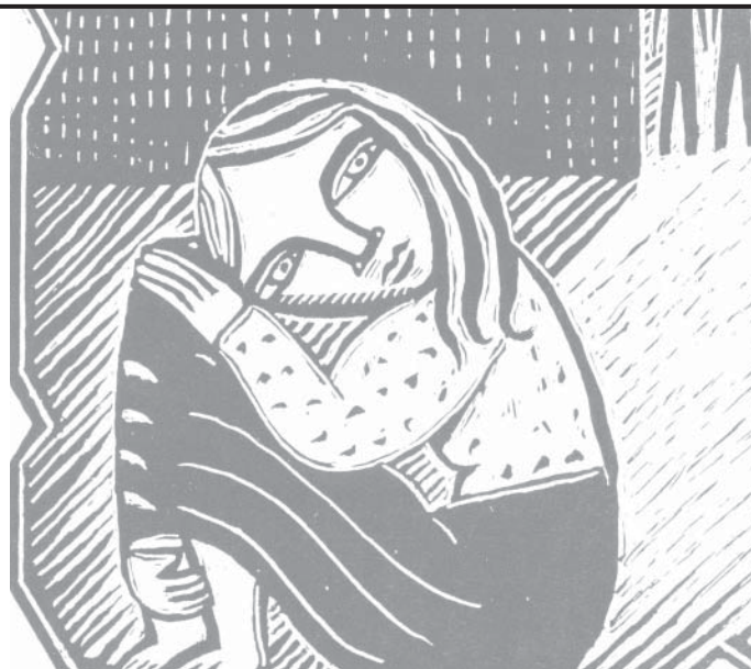
Ilustração: mfiempres nº 141

Quem acompanhou as últimas edições do jornal Fêmea e as notícias do sítio eletrônico do CFEMEA torceu junto durante a trajetória da Lei 11.340/2006. A Lei Maria da Penha já foi conhecida como Projeto de Lei 4.559/2004 e Projeto de Lei da Câmara (em tramitação no Senado) PLC 37/2006. Hoje ela é um dos recursos mais importantes para o enfrentamento da violência doméstica e familiar que atinge milhões de mulheres em todo o Brasil.