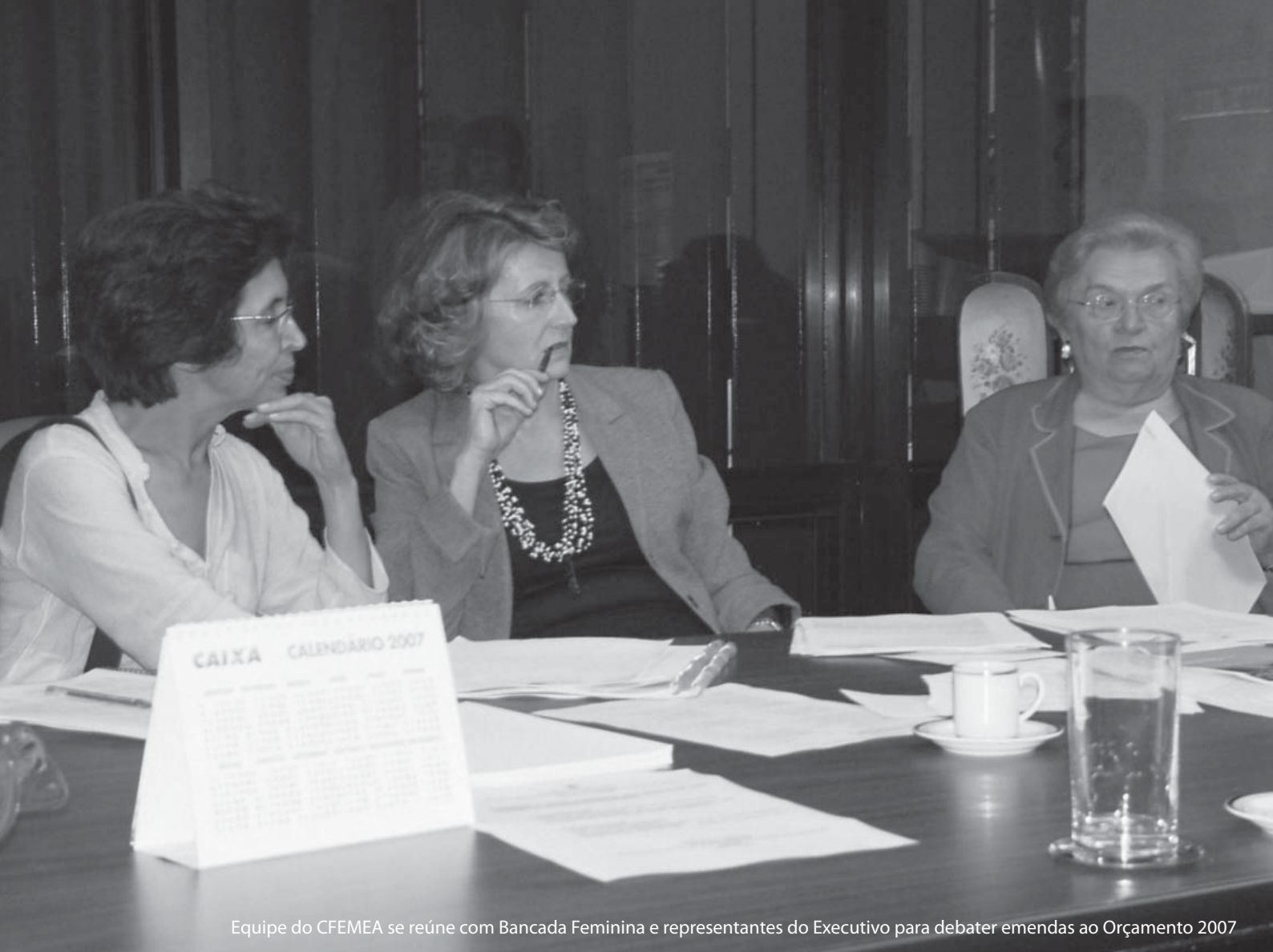
Equipe do CFEMEA se reúne com Bancada Feminina e representantes do Executivo para debater emendas ao Orçamento 2007